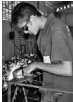
Nebst einem Handwerk lernen die jungen Leute, über soziale und politische Fragen nachzudenken und sich zu engagieren.

Die KAB St. Gallen unterstützt die Berufsausbildung von Jugendlichen aus armen Verhältnissen und von ungelernen Arbeiterinnen und Arbeitern in Recife, Brasilien. Wie läuft dieses Projekt Boa Vista? Was bewirkt es? Wie arbeitet das Zentrum für Arbeit und Kultur, die Partnerorganisation von «Brücke · Le pont» vor Ort?