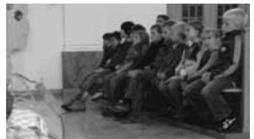
Der hl. Karl wäre am letzten Erntedank wohl stolz gewesen, eine so schöne Schar Kinder in der ersten Bank anzutreffen.

Darum singt am Kirchenfest unser Kirchenchor Cantamus zur Ehre des Kirchenpatrons und zu unser aller Freude. Und anschliessend ist die «ganze Kirche» vom Pfarreierrat zum Apéro ins Pfarreiheim eingeladen.