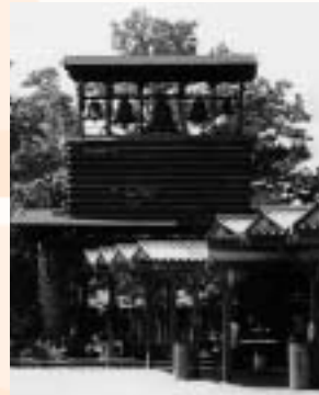
Die Glocken rufen dreimal täglich zum Gebet