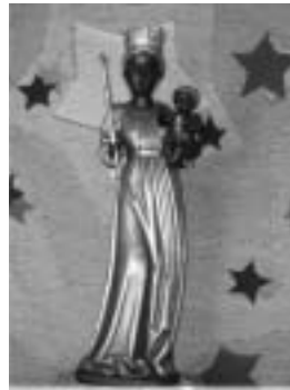
Marienstatue Marienkapelle Pfarrkirche Schmerikon

Der Oktober gilt seit dem Mittelalter als Rosenkranzmonat und ist – wie der Mai – als Marienmonat, der Gottesmutter Maria geweiht.