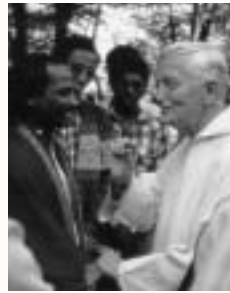
Frère Roger mit Gästen