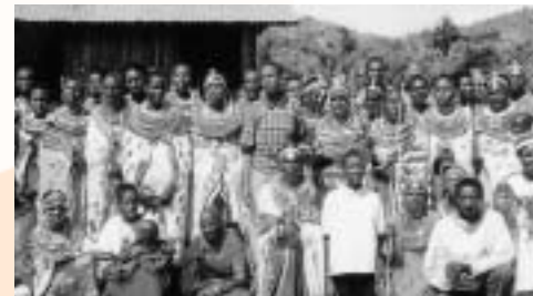
Eine Gruppe Frauen mit Kindern nach einem Kurs vor dem Ausbildungsgebäude.